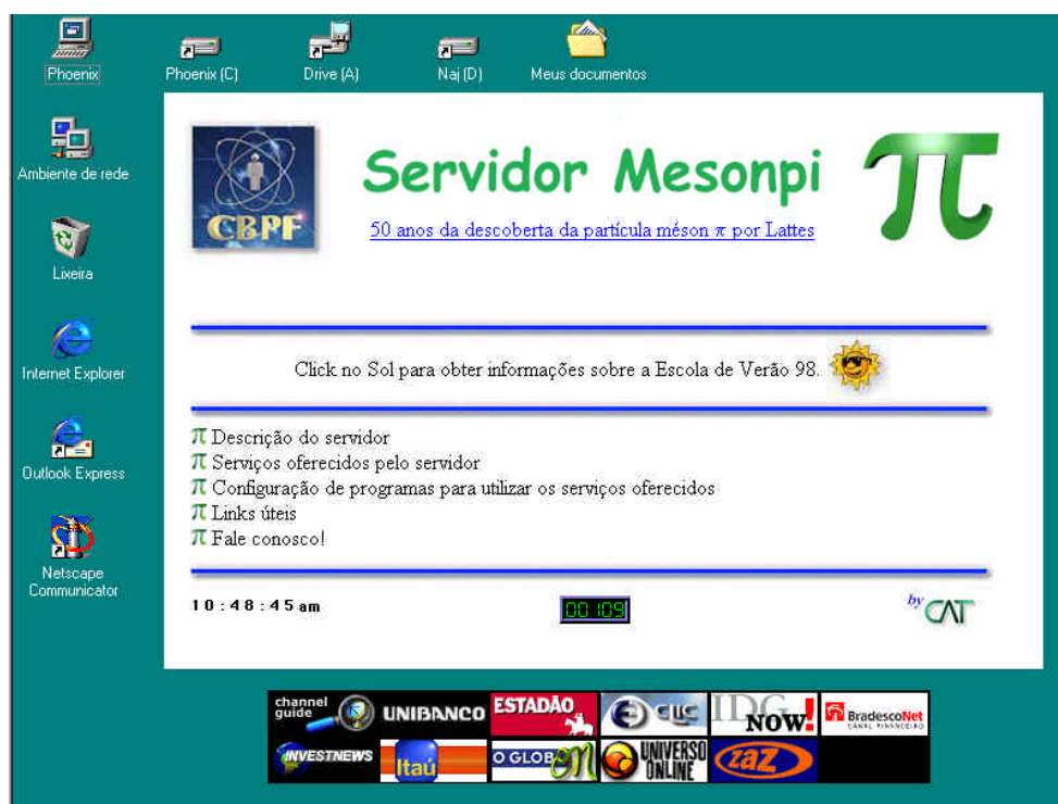
Figura 2: Área de trabalho ativa com a página do Servidor Mesonpi

A Área de trabalho ativa é constituída de duas camadas: uma é transparente, permitindo que os ícones e os atalhos personalizados do usuário fiquem visíveis; a outra é a camada HTML, que fica no plano de fundo da tela, isto é, no mesmo nível do papel de parede. Nesta camada HTML o usuário pode adicionar o conteúdo de qualquer página HTML e navegar por ela, mesmo que contenha componentes Java, ActiveX, imagens, sons, vídeos, etc. Por isso ela recebe o nome de área de trabalho ativa.